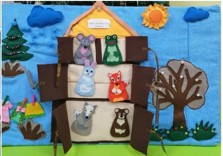
Театр на столе «Заяушкина избушка», «Колобок»